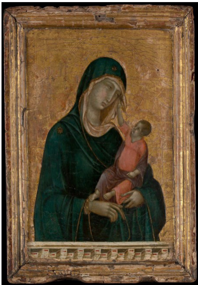
Дуччо ди Буонинсенья, 1290 – 1300-е гг.

на сына, предчувствуя трагическую судьбу своего ребенка. Что же касается изображения Иисуса, то художник придает ему вид маленького взрослого человека. Мадонна держит ребенка обеими руками, их взгляды встречаются, а взаимодействие со зрителем отсутствует. Фигуры полностью погружены друг в друга. Мимика Мадонны с младенцем не отличается особой эмоциональностью, их лица серьезны, однако эмоция передается через жесты персонажей. Зритель видит глубоко личный и интимный момент в жизни Мадонны и младенца. Оконная рама в нижней части иконы символична. Она использовалась для того, чтобы дать зрителю ощущение, будто он заглянул в другой мир и увидел один из моментов жизни святых персонажей. Этот переход одновременно и соединяет земной мир с божественным, и создает некую преграду. С одной стороны, мы способны видеть божественную реальность, а с другой стороны, сами фигуры не взаимодействуют со зрителем. Мы не чувствуем той связи, которая присутствует в иконе Берлингiero. Однако здесь мы видим