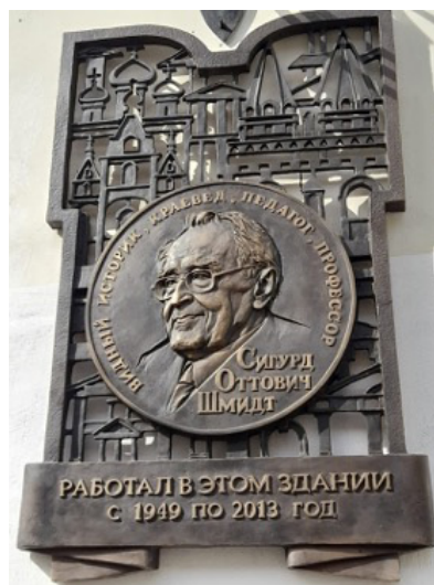
Мемориальная доска в честь С.О. Шмидта на здании Историко-архивного института

СО был выдающимся коллегой и учителем, но и в этом его влияние на людей не ограничивалось. Множество людей, взаимодействовавших со Шмидтом, даже самым эпизодическим образом, сохраняли о нем самые восторженные воспоминания. Я был свидетелем того, как Шмидт проявлял интерес к человеку, казалось бы, малоинтересному, далекому от гуманитарной