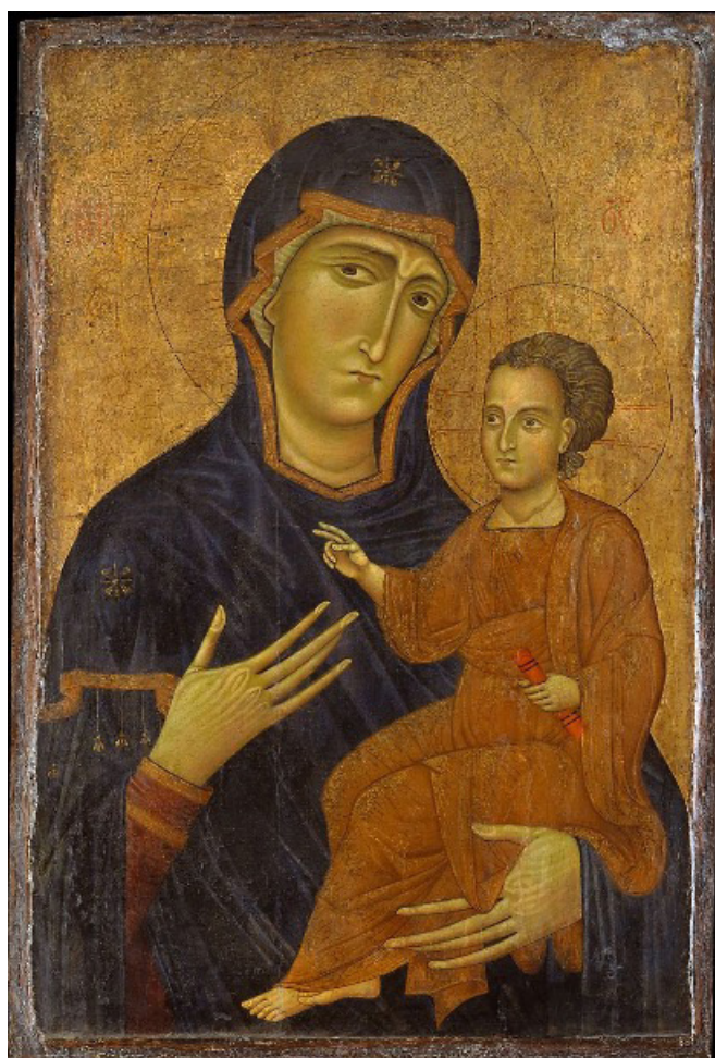
Берлингiero, предположительно 1230-е гг.

Вашему вниманию предлагается «Мадонна с младенцем» Берлингiero, 1230-е гг. Берлингiero является важной фигурой в истории Тосканской живописи. В его творчестве мы можем увидеть сильное влияние византийского искусства, которое стало недавно доступным для итальянских художников. После взятия Константинополя западноевропейскими войсками в ходе Четвертого крестового похода (1202 – 1204 гг.) многие произведения искусства были рассредоточены и