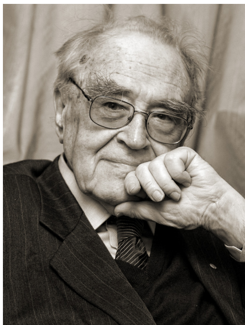
Сигурд Оттович Шмидт. 2012 г.

Russian State University for the Humanities (RSUH), Moscow, Russia