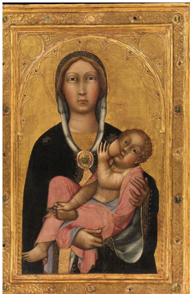
Паоло ди Джованни, 1370-е гг.

использует такое же цветовое отношение. Фигура Иисуса в светлых одеждах ярко выделяется на фоне черного плаща матери. Кроме того, Джованни детально прорисовывает золотой медальон Мадонны и золотое кружево. Художник даже затемняет накидку на шее Мадонны, подчеркивая ее лицо. Мы видим, как по мере приближения к XV в. художники осваивали приемы передачи трехмерного пространства. Художник затемняет те части, которые зрительно дальше, и, наоборот, высветляет те, что ближе. Глядя на золотой фон, мы видим, что нимбы фигур не такие четкие, увидеть их мы можем, только внимательно