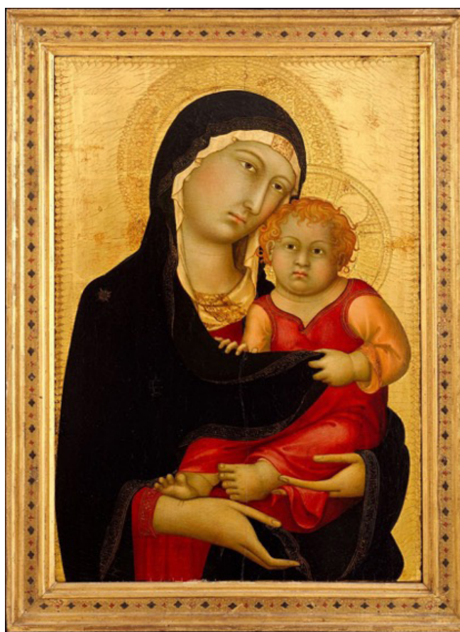
Симоне Мартини, 1326 г.

Глядя сквозь простоту образа Дуччо, можно понять изменения, внесенные художником в изображение религиозных деятелей в конце XIII – начале XIV в. В иконе Дуччо мы можем отметить влияние Джотто. Полутона двух фигур уже не так контрастны, и художник заметно лучше владеет техникой светотени. В иконе Дуччо мы видим, как художник вышел за рамки византийского канона и создал более осязаемую связь между зрителем и фигурами на иконе. Таким образом, оконная рама в нижней части картины служит для зрителя возможностью заглянуть в прошлое в момент, запечатленный между Богородицей и младенцем